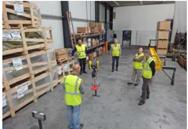
Die Ausbildung muss von Personen mit dem erforderlichen Fachwissen vermittelt werden.

Bei Änderungen der Einsatzbedingungen (beispielsweise anderer Krantyp, Andere Lastaufnahmemittel, Änderung der Steuerung) ist eine ergänzende Instruktion erforderlich (z.B. überprüfen des Fachwissens, korrekte Handhabung, Neuerungen).